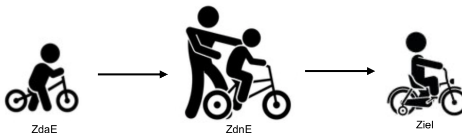
Abbildung 2: Von der ZdaE in die ZdnE